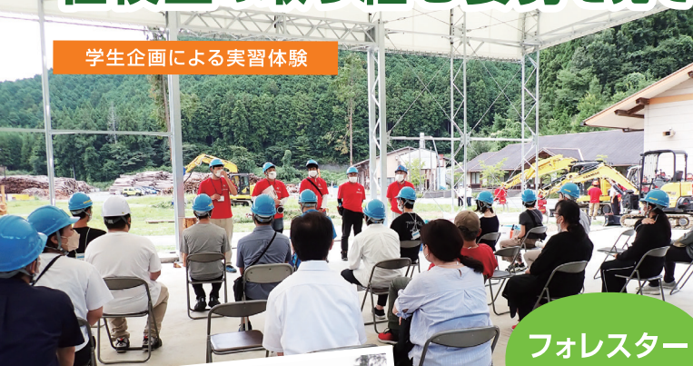
学生企画による実習体験

「学校・入試説明」「施設見学」「模擬授業」「在校生・職員とのフリートーク」「学生企画による実習体験」を実施します。1日をとおして奈良県フォレスターアカデミーが育てる人材像、そのためのカリキュラム、学生生活や就職について知ることができるプログラムとなっています。特にフリートークでは講師や在学生やから直接話を聞けます。「アカデミーに入学して実際どうなのか」本音でトークをしていただけます。また、学生企画による実習体験では、模擬実習により普段どんなことを学んでいるのか体験していただけます！満足いただける暑い1日をお届けできるよう頑張ります！