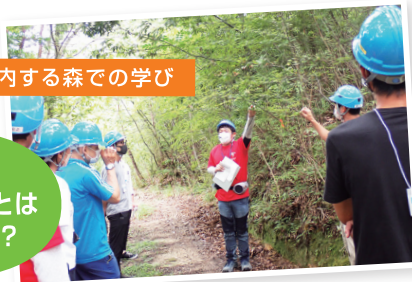
学生が案内する森での学び