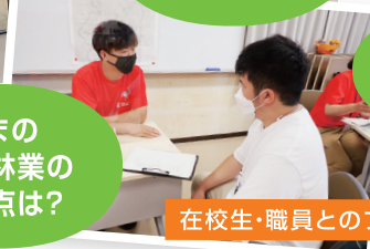
在校生・職員とのフリートーク