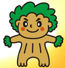
明日香村森林組合 イメージキャラクター もありん